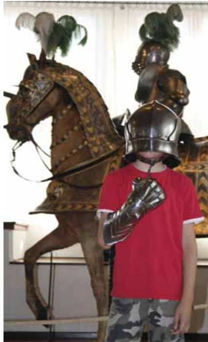
Mit den spannenden Angeboten der vhs tappen kleine Mittelalter-Detektive nicht länger im Dunkeln.

Alle Angebote können für Kindergärten, Schulen oder Geburtstagsfeiern individuell geplant und gebucht werden. Die Mitarbeiter der Volkshochschule gehen gern auf Ihre Wünsche und Ideen ein. Auf ins Abenteuer!