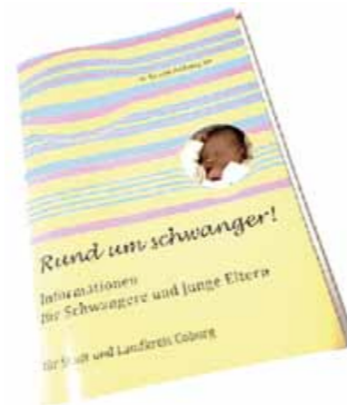
Diese Broschüre können Sie über die Schwangerenberatungsstellen anfordern.

Landratsamt Coburg Lauterer Str. 60, Coburg ☎ 09561 514-562 oder 514-159