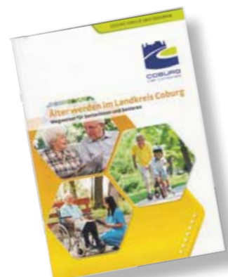
Diese Broschüre können Sie über das Familienbüro anfordern.

Informationen dazu gibt es im Rathaus und bei den Seniorenbeauftragten.