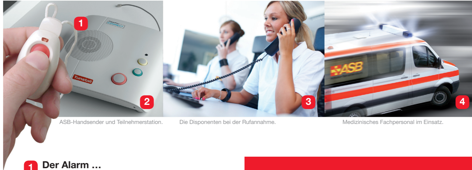
ASB-Handsender und Teilnehmerstation.