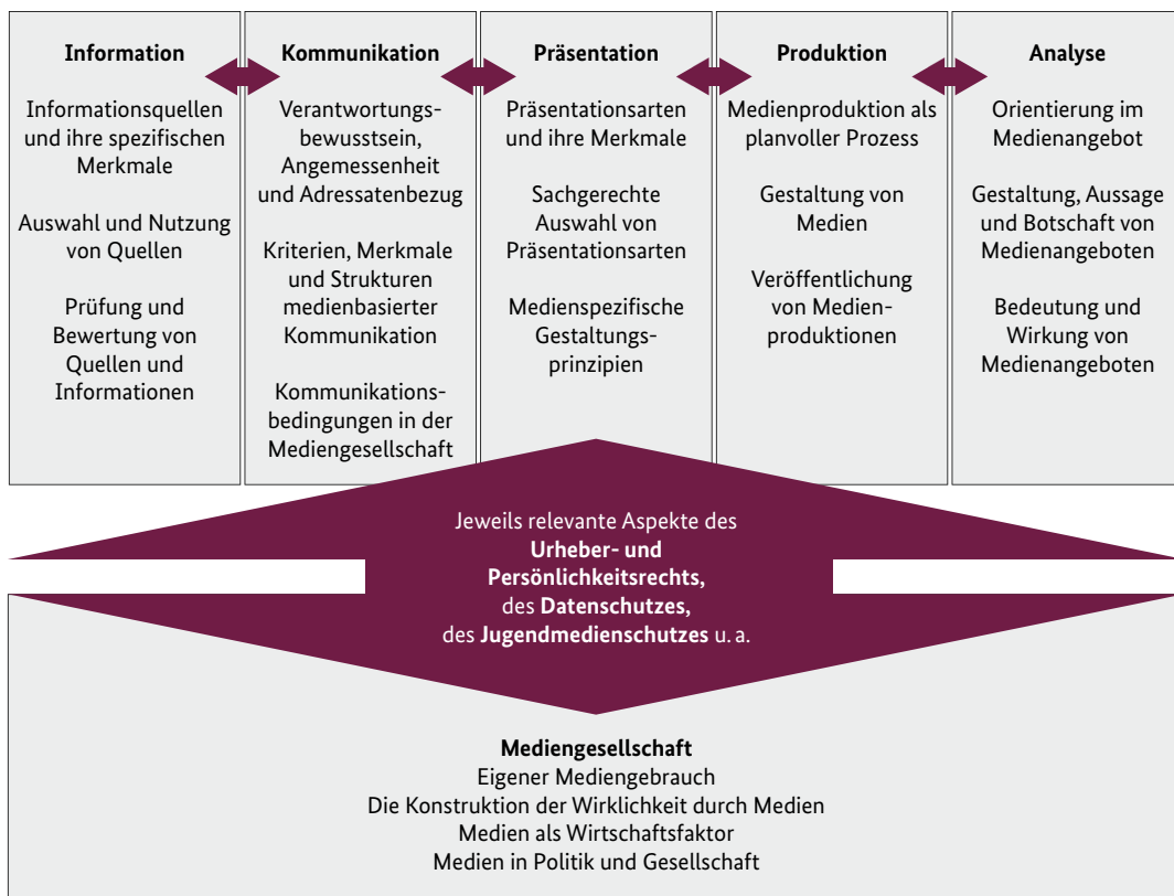
Abb. 1: LKM Positionspapier

Der Erwerb von Medienkompetenz wird als Teil von Allgemeinbildung bzw. der allgemeinen Persönlichkeitsentwicklung verstanden, über die ein handelndes Subjekt verfügen sollte. Die Vermittlung von Medienkompetenz wird als bedeutsame Erziehungsaufgabe angesehen, die aus Wissen, Können, Anwenden, Gestalten, Reflektieren und Handeln besteht. Konstatiert wird, dass das Lernen mit Medien zum Erwerb fachlicher Kompetenzen in der Schule anerkannt sei, dass jedoch das Lernen über Medien eindeutig unterrepräsentiert ist. Obwohl Medienkompetenz in der öffentlichen Diskussion eine zunehmende Rolle spielt, spiegelt sich dessen Bedeutung in keinem Schulfach. Auch bei den Schlüsselkompetenzen für lebensbegleitendes Lernen der Europäischen Union wird Medienkompetenz nicht aufgeführt. Das Positionspapier versteht sich als Reflexions- und Orientierungshilfe zur Umsetzung fachspezifischer und fächerübergreifender Kompetenzerwartungen bezogen auf Medienbildung in der Schule. Zielperspektiven sind anwendungsbereite Kenntnisse, Fähigkeiten und Fertigkeiten am Ende des 10. Schuljahres. In dem Positionspapier werden sechs Kompetenzbereiche benannt: Information, Kommunikation, Präsentation, Produktion, Analyse, Mediengesellschaft.